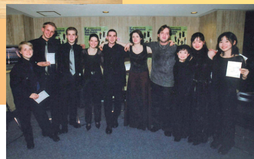
他の参加者とともに(左から三番目)