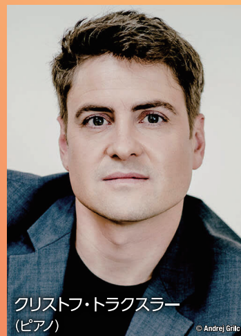
クリストフ・トラクスラー (ピアノ)